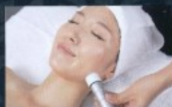
リフトアップにも最適

☆ツボを意識したピンポイント施術が可能 ☆熱をより伝わりやすく ☆リフトアップ効果強化 ☆即効性・持続性アップ