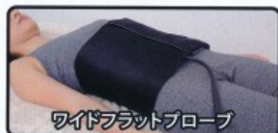
ワイドフラットプローブ