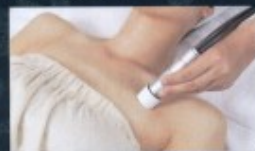
デコルテにも対応